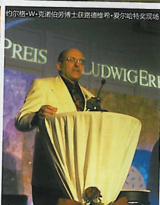
约尔格·W·克诺伯劳博士在柏林演讲