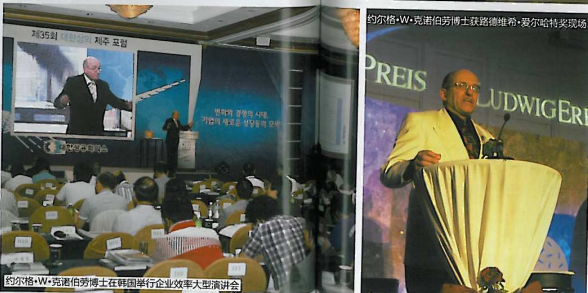
约尔格·W·克诺伯劳博士在韩举行企业效率大师演讲会